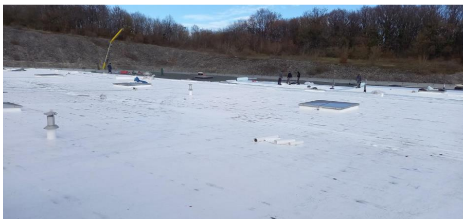
Photo de la toiture en cours de rénovation à l'ESAT de Belfort